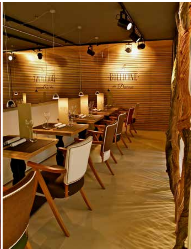
（左图）古玩与当代艺术同处一个空间，也是米兰的时尚之道。（右图）极具风格的餐厅 Le Bollicine del Duomo。