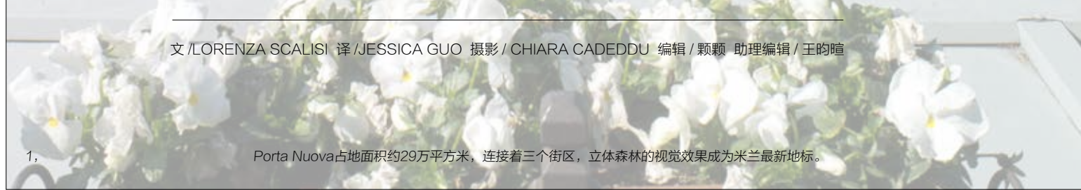
1. Porta Nuova占地面积约29万平方米，连接着三个街区，立体森林的视觉效果成为米兰最新地标。

文 / LORENZA SCALISI 译 / JESSICA GUO 编辑 / 颖颖 助理编辑 / 王昀喆