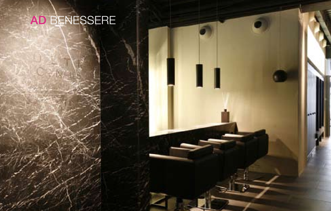
Fotografie di Chiara Cadeccu