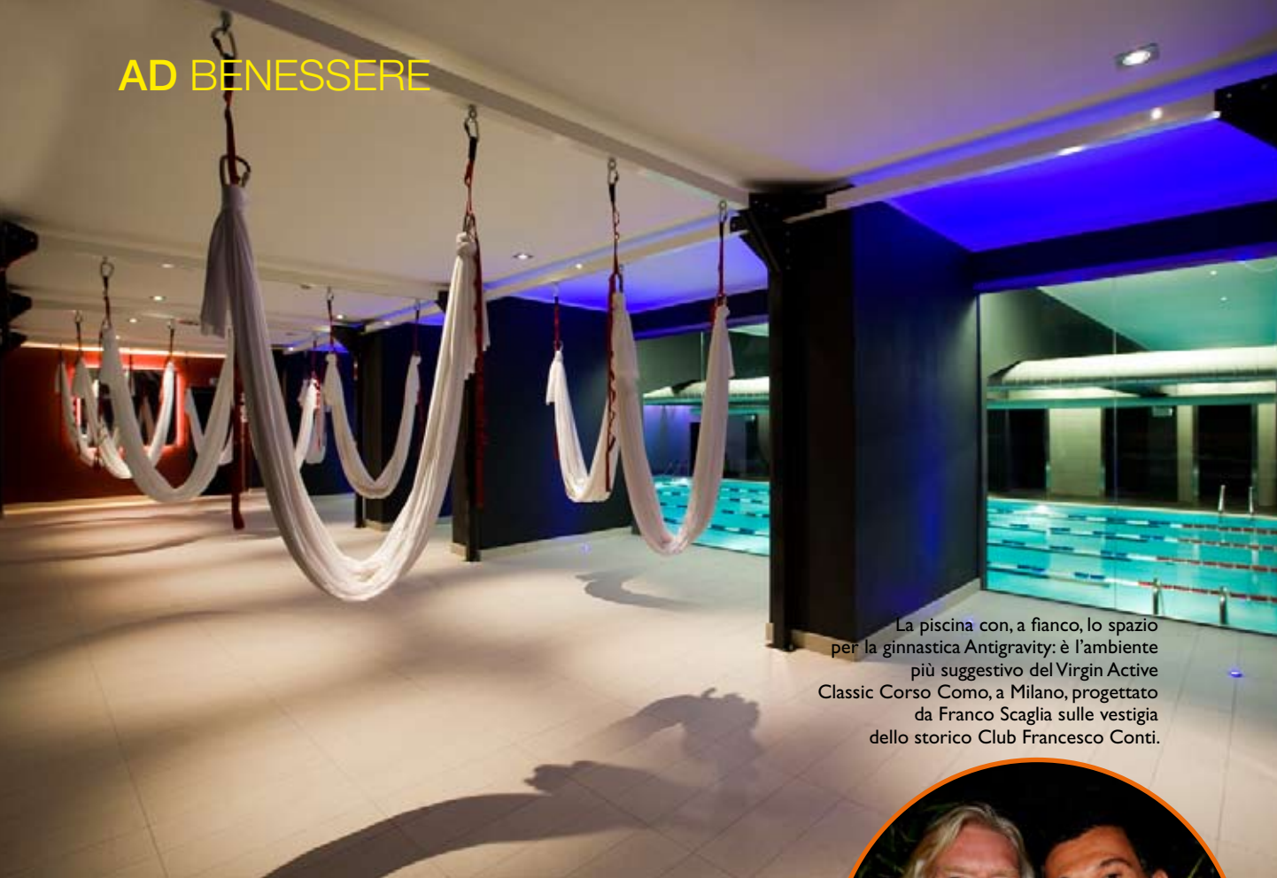
La piscina con, a fianco, lo spazio per la ginnastica Antigravity: è l'ambiente più suggestivo del Virgin Active Classic Corso Como, a Milano, progettato da Franco Scaglia sulle vestigia dello storico Club Francesco Conti.